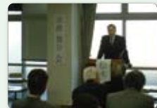
平成24年2月5日 ゆうゆうセンター

この間、私の市議会議員としての活動の報告として、2月と6月の計2回、交野市の財政状況と課題を中心とした市政報告会を開催しました。新人ですので、より多くの市民に私の活動を報告したいと考え、議員就任後1年間は、本会議ごとの開催を予定しています。どうかお運び戴けますと幸甚に存じます。