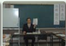
平成24年2月5日 交野会館