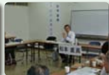
平成24年6月16日 青年の家