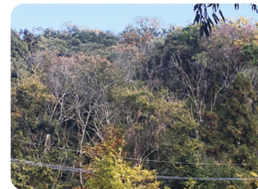
対策事業対象のナラ枯れ

また、旧大阪府規則で指定されている名勝『鮎返しの滝』の大阪府条例による指定に向けた支援や安全対策を求めた周辺の道路整備に取り組んでいます。